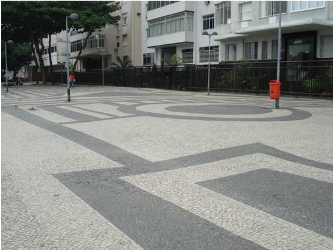
Figura 7: Imagen de zona del paseo donde el protagonista es el dibujo materializado con la piedra portuguesa

Estos análisis nos proporcionan información acerca de las claves espaciales del paseo y de los posibles recorridos alternativos que se pueden desarrollar a lo largo del paseo.