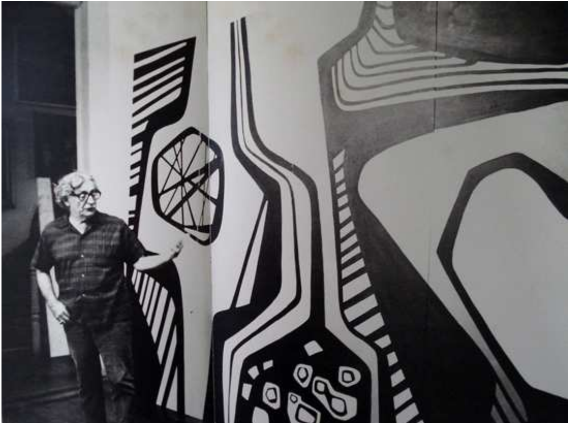
Figura 5: Burle Marx presentando el paseo de Copacabana en la Bienal de Venecia de 1970.