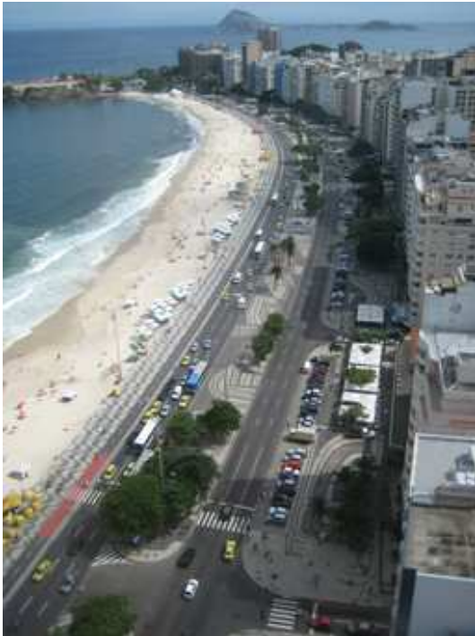
Figura 4: Imagen aérea del Paseo de Copacabana desde el Hotel Oton Palace