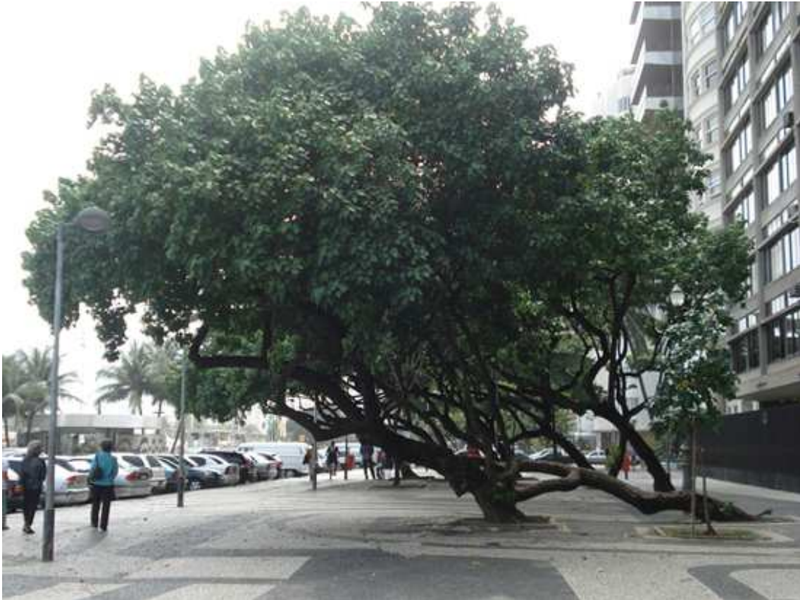
Figura 8: Imagen de zona del paseo donde el protagonista es la vegetación escultórica