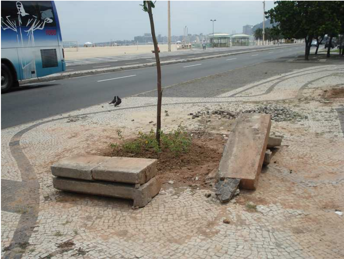
Figura 9: Imagen de zona del paseo donde se puede contemplar el abandono y destrucción en que se encuentra el pavimento, la vegetación y el mobiliário urbano