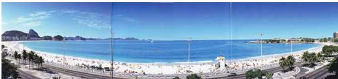
Fig. 1: Imagen actual de la avenida Atlántica, Paseo de Copacabana