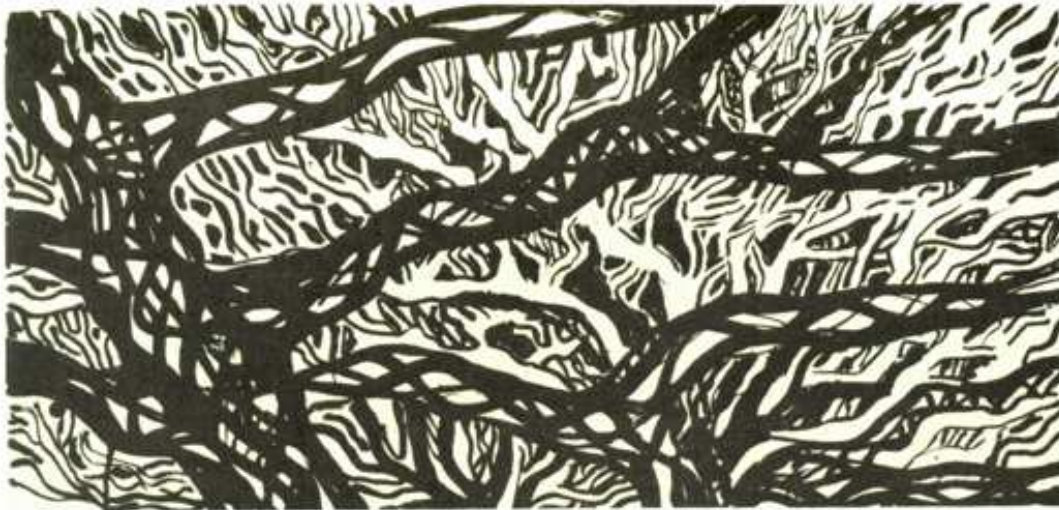
Figura 6: Dibujo de Roberto Burle Marx. Chloroleucon tortum, 1964.

En un siguiente acercamiento de mayor proximidad visual se plantea el zoom +2, donde centrándonos en una única unidad, al desarrollar un análisis gráfico exhaustivo de su subsistema de líneas, estructura y composición, se pueden empezar a identificar esas unidades pictóricas concretas con diferentes geometrías de otras obras suyas, con otros movimientos artísticos o con trazos del arte indígena, los cuales muestran cómo el paseo de Copacabana es un reflejo de su recorrido y un cúmulo de la experiencia de toda su vida. Investigar estas influencias, implica documentar todas sus intervenciones.