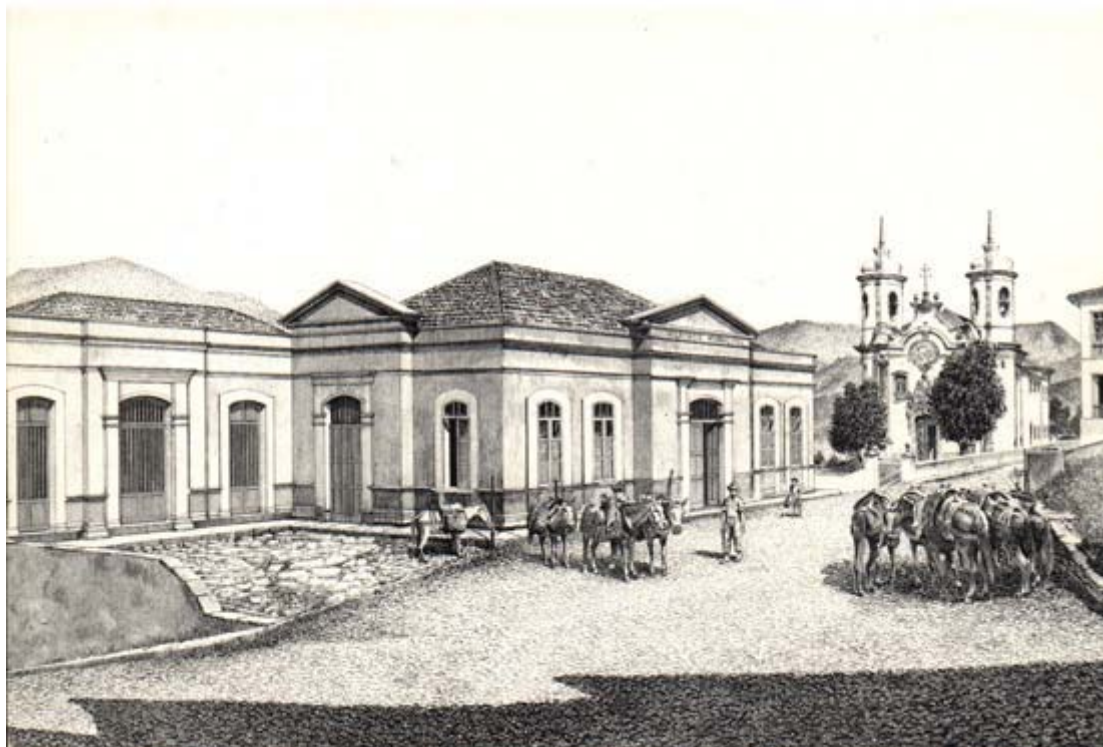
Figura 2: Largo do Coimbra, Ouro Preto, início da década de 1940.

nesse espaço além do mercado. Em ofício de 5/10/1944, Eduardo Tecles, chefe da delegacia regional da SPHAN, escreveu para Rodrigo M. F. de Andrade: “Agradecendo-vos pelas informações prestadas em vosso ofício datado de 2 do corrente acerca das providências que tomastes para a oportuna execução das obras projetadas pelo arquiteto Lúcio Costa em benefício da praça fronteira à igreja São Francisco de Assis, fico na expectativa de vossa ulterior comunicação acerca do entendimento que o Sr. Prefeito Municipal deverá ter com o proprietário de açougue a ser demolido na referida praça” 17 .