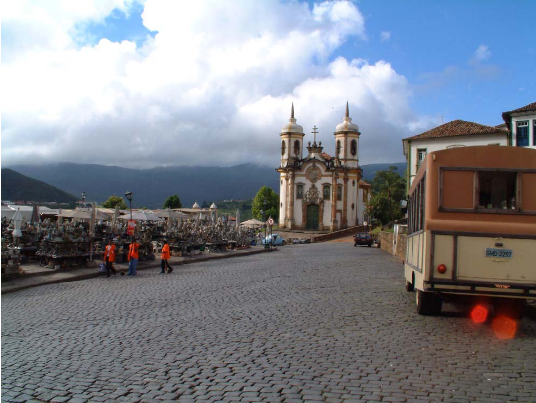
Figura 1: Largo do Coimbra, Ouro Preto, 2002.

a residência do inconfidente Tomás Gonzaga, na Rua Cláudio Manoel nº61, atualmente sede da Secretaria de Turismo e Cultura de Ouro Preto. É interessante notar como ainda são fortes associações simbólicas com os eventos e personagens da Inconfidência Mineira - símbolo dos ideais nacionalistas de autonomia política - e a presença desses “heróis” nacionais criados pelos intelectuais modernos na busca de um ideal histórico.