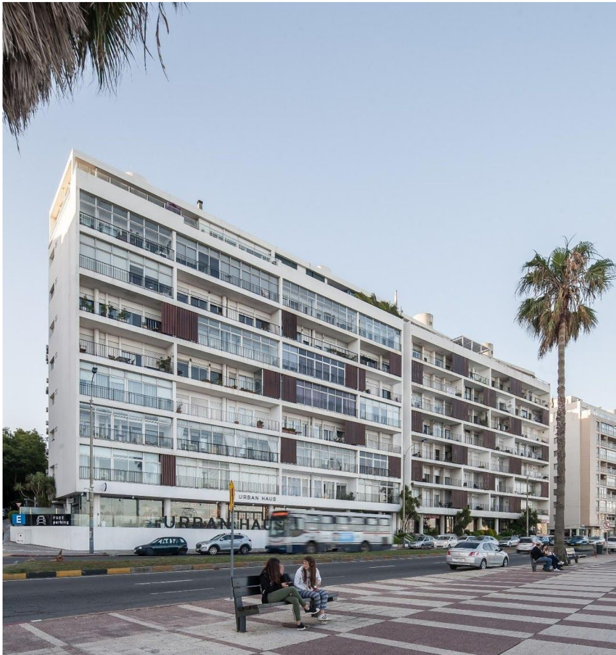
Figura 2. Edifícios Guayaquí (1951) y Martí (1954) Arq. Raúl Sichero. Implantados sobre el frente costero de Pocitos, es posible ver la continuidad entre ambas intervenciones y el estado de conservación que presentan actualmente, con el edificio Martí muy alterado.

traseira. Esta localização também incentiva a prestação de unidades de serviço em seu ambiente, banheiros e cozinhas como um quarto de serviço, proporcionando uma clara divisão espacial frente-fundo, onde os espaços de vida diária são orientados para a rua e os